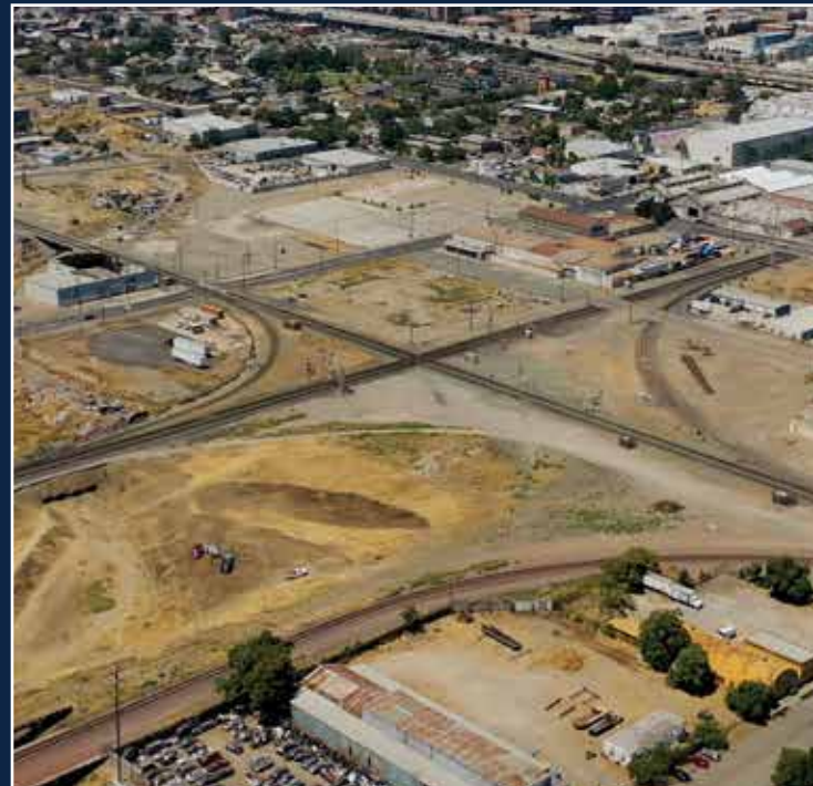
ALTERNATIVA 1 No Hay Construcción

El Proyecto estudió dos alternativas: una Alternativa de No Construir, y el Proyecto Propuesto —también conocido como Alternativa 2.