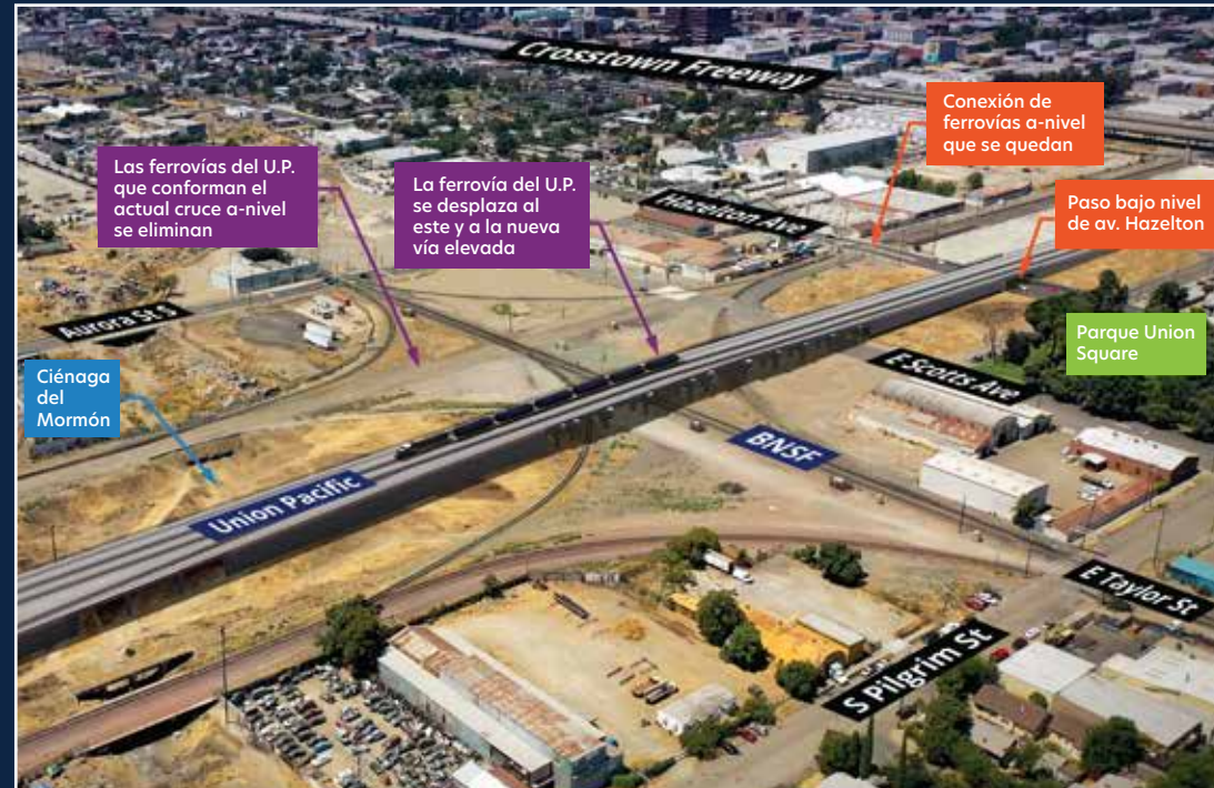
ALTERNATIVA 2 Proyecto Propuesto